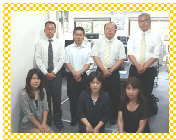
オー・ティー・アイ事業(協)の職員

古代より近世までは水郷農村として栄えた地である門真(かどま)は「河内レンコン」が全国的に有名でした。しかし、近代になり世界的有名な家電メーカーの誘致に成功して企業城下町として栄え、現代は商業都市大阪(大阪城)の北東に位置する衛星都市として位置づけられています。