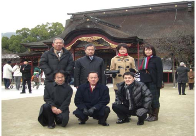
トータルビジネス(協)職員の皆様 大宰府天満宮 初詣の様子

さて、当組合の事務所は大野城市にあり、福岡市の南に位置し、人口約10万人の福岡県の中堅都市で、九州自動車道大宰府インターチェンジそれに接続されている福岡都市高速道路や福岡空港にも近接している事から福岡都市圏で最も交通の便に恵まれた地域となっています。近くには大宰府天満宮があり、菅原道真公の御墓所の上に社殿を造営して、その神霊を御奉祀する神社で、「学問の神」「至誠の神」として世の崇敬を集めており、正月の三が日は全国各地から毎年200万人以上の参拝者でにぎわっております。又、日本に4箇所しかない国立博物館の九州国立博物館もあり、昨年7月から9月迄国宝阿修羅展が開催され、多くの入館者がありました。