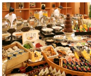
有馬の金泉にゆっくり入った後は、おいしい料理で舌鼓♪♪