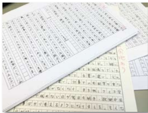
応募作品の「生原稿」

中国では花にぜんぜんきょうみがなかったけど、桜を美しさを見てからよく見ると日本にはいろいろな花がさいています。桜のおかげでほかの花の美しさに気がつきました。日本人は桜が好きですから、ほかの花も好きですね。町にでかけてきれいな花を見たら気持ち良くなります。