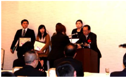
表彰状の授与の様様