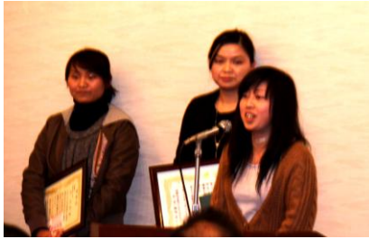
表彰を受けて喜びの挨拶をする実習生