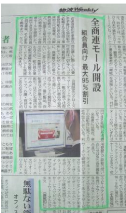
平成24年3月26日付物流ウィークリーにて「全商連モール」が取り上げられました。

お問い合わせにつきましては、組合員様にご加入されております組合事務局までお願い致します。