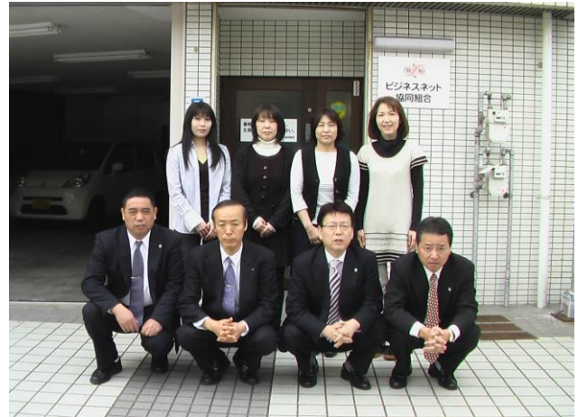
ビジネスネット(協)職員の皆様

さて、当組合の事務所は広島市西区にあり、広島駅から車で25分位の所に位置しております。広島といえば結構スポーツの盛んな土地柄で色々なスポーツ観戦を楽しむには非常に便利な場所にあります。野球であれば広島カープ、サッカーであればサンフレッチェ広島とそれぞれプロ球団があり、広島カープは去年、大リーグ球場並みの新球場が出来て多くのファンが観戦を楽しみ、年間入場者の最高記録を更新しました。私達職員も全員で観戦に行きましたが、野球以外にも楽しめ本当に日本一の球場だと思えました。広島に来られることがありましたら広島駅からすぐ近くですし、試合が開催される日以外でもスタジアムを見学できるようコンコースの開放やスタジアムツアーが開催される日がありますので機会があれば一度訪れてみては如何でしょうか？