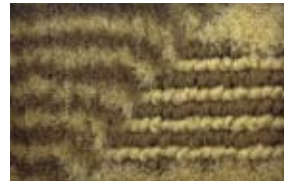
ミックスベージュ